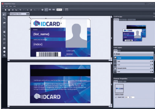
Het ontwerpen van een kaart in BadgeMaker.

Creëer professionele kaartlayouts met achtergronden, dynamische velden, figuren, afbeeldingen, barcodes en QR-codes in de intuïtieve kaart designer van BadgeMaker. Kaartontwerpen garanderen een 1:1 vertaling van het ontwerp naar de geprinte kaart.