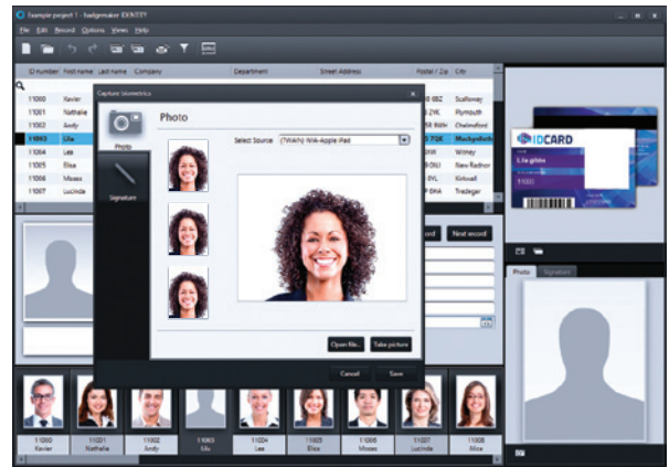
Beheer en produceer kaarten in BadgeMaker.

Bedrijfsidentiteit begint met een professioneel kaartontwerp, hierna zal de focus vooral liggen bij het beheren van gegevens en het produceren van kaarten. BadgeMaker biedt toegankelijk gegevensbeheer en effectieve kaartproductie.